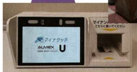
マイナンバーカードによる保険証確認端末