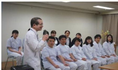
新入職員紹介・院長あいさつ

新年度を迎え、当院では医師、医療技術者、看護職員合わせて13名の新入職員が入職しました。どうぞよろしくお願ひします。